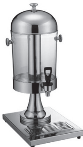
Dyspenser do soku