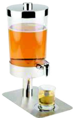
Dyspenser do soku