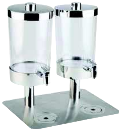
Dyspenser do soków