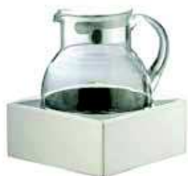
Termalna podstawa z dzbankiem