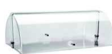
Pokrywa roll-top nakładana