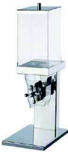
Dyspenser do płatków abert