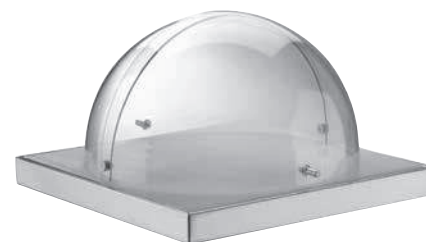
Pojemnik chłodzący z pokrywą roll-top

Stal nierdzewna 18/10, wyskopolerowana • W zestawie szklana miska śr.23 cm i pokrywa z wycięciem na łyżkę