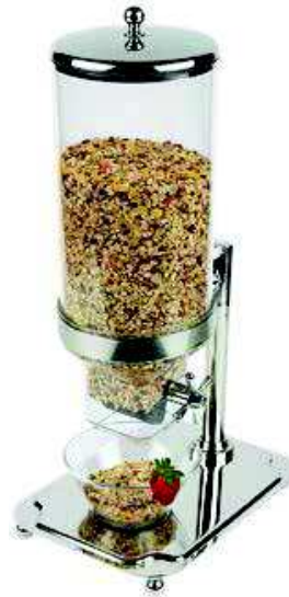
Dyspenser do płatków CLASSIC

Stal nierdzewna 18/10, wyskopolerowana • Możliwość mycia w zmywarkach