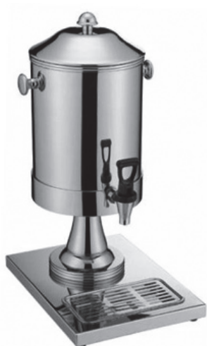
Dyspenser do mleka