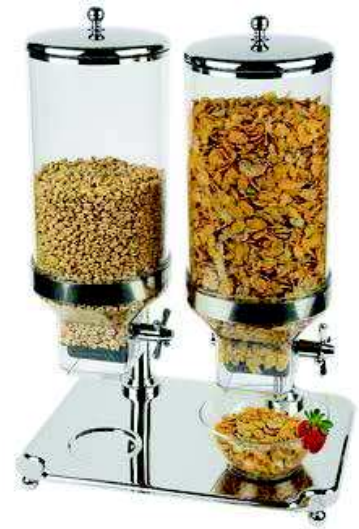
Dyspenser do płatków CLASSIC DUO

Stal nierdzewna 18/10, wyskopolerowana • Możliwość mycia w zmywarkach