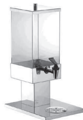
Dyspenser do soku abert