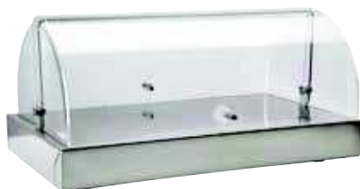
Pojemnik chłodzący z pokrywą roll-top