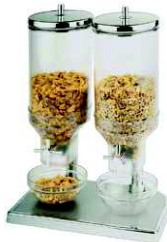
Dyspenser do płatków FRESH & EASY

Pokrywa wykonana ze stali nierdzewnej • Podstawa ze stopu cynku, chromowana • Pojemnik na płatki - z poliwęglanu