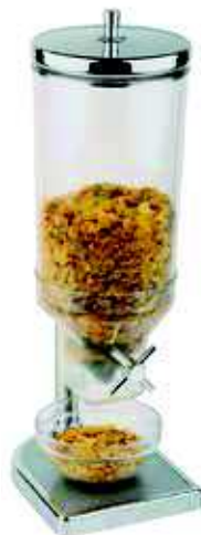
Dyspenser do płatków FRESH & EASY

Stal nierdzewna 18/10, wyskopolerowana • Możliwość mycia w zmywarkach