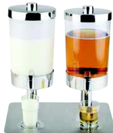
Dyspenser do soku i mleka