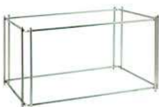
Stojak pod tace i pojemniki GN 1/1

Stal nierdzewna 18/10, wyskopolerowana • Pokrywa z tworzywa SAN