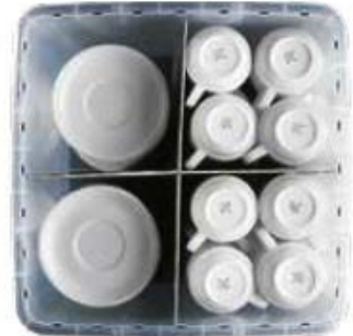
ok. 56 filiżanek i spodków