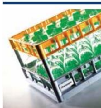
Systemy koszy 600 x 400 dla logistyki i cateringu