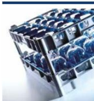
Systemy koszy 500 x 500 do standardowych zmywarek gastronomicznych