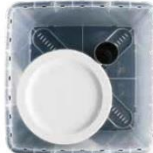
ok. 24 talerzy Ø 26 cm