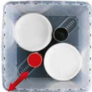
ok. 60 talerzy Ø 19 cm

Rura stabilizacyjna jest mocowana w dnie pojemnika i pokrywie za pomocą specjalnych wpustek.