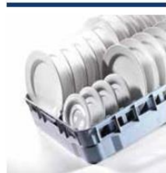
Systemy koszy 600 x 500 do zmywarek przelotowych