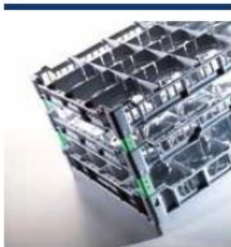
Systemy koszy 400 x 400 do zmywarek barowych (podbłatowych)

Proszę zapoznać się z różnorodnością naszych produktów.